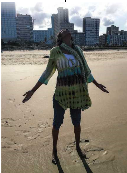
На заднем плане: Дурбан, Южная Африка, место проведения 25-ой Конференции АА по Всемирному обслуживанию.