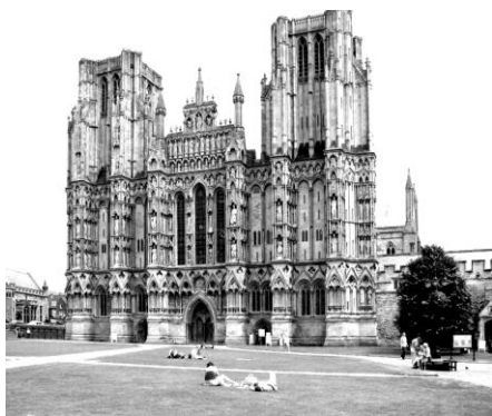
Уинчестерский собор Хэмпшир

С 19 по 22 июня 2008 года в Уинчестере (Англия) в Гилдхолл (The Guildhall, The Broadway, Winchester; Гилдхол - место, где обычно проводятся собрания, митинги – прим. перевод.) состоялась Конвенция АА ( ред. - Форум АА) «Winchester, AA Convention, 2008». Тема: «В НАЧАЛЕ главы 2» (ВЫХОД ЕСТЬ)».