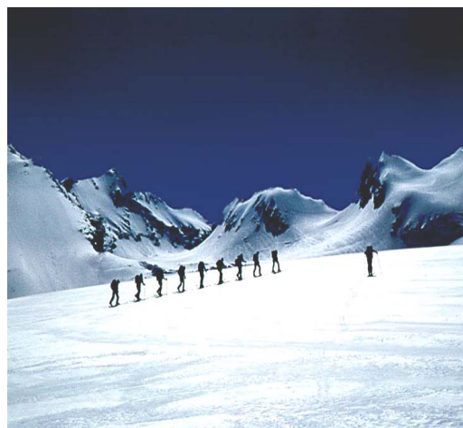
« Ш А Г З А Ш А Г О М »

Мы искренне рады, что и на Северном Кавказе работают и развиваются группы А.А., а идеи выздоровления, изложенные в Программе «12 Шагов», продолжают находить все новых сторонников.